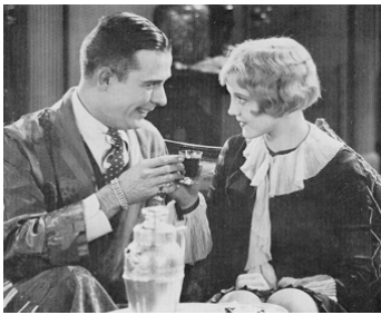
1927 LADIES MUST DRESS de Victor Heerman avec Earle Foxe