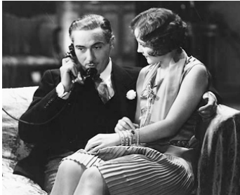
1929 LE RÊVE IMMOLÉ (The Shopworn Angel) de Richard Wallace avec Paul Lukas