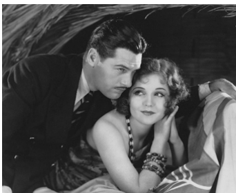
1929 DANGEROUS PARADISE de William A. Wellman avec Richard Arlen