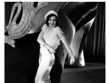
1930 PARAMOUNT ON PARADE d'Edmund Goulding, Victor Schertzinger