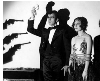
1929 ILLUSION (Illusion) de Lothar Mendes avec Charles Buddy Rogers