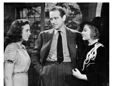
1938 CET ÂGE INGRAT (That certain Age) d'E. Ludwig avec D. Durbin, Melvyn Douglas