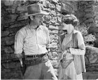
1928 LE TROU DANS L'EAU (The Water Hole) de F. Richard Jones avec Jack Holt