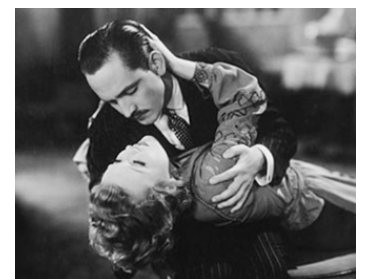
1931 L'ANGE DE LA NUIT (Night Angel) d'Edmund Goulding avec Fredric March