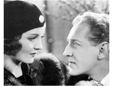
1934 SPRINGTIME FOR HENRY de Frank Tuttle avec Otto Kruger