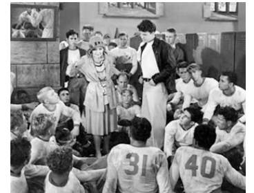
1929 GRANDE CHÉRIE (Sweetie) de Frank Tuttle avec Stuart Erwin