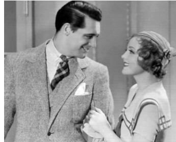
1933 CELLE QU'ON ACCUSE (Woman accused) de Paul Sloane avec Cary Grant