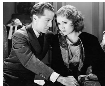
1930 VOLEUSE (The Devil's Holiday) d'Edmund Goulding avec Morgan Farley