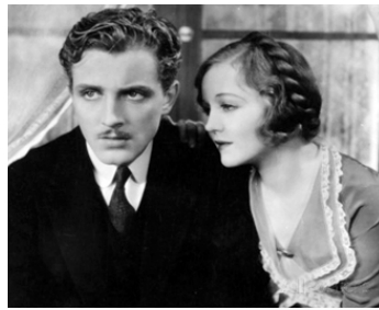
1931 L'HOMME QUE J'AI TUÉ (Broken Lullaby) d'Ernst Lubitsch avec Phillip Holmes