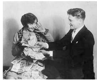
1928 EASY COME, EASY GO de Frank Tuttle avec Richard Dix