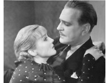
1933 LE BAISER DEVANT LE MIROIR (The Kiss before the Mirror) de J. Whale avec F. Morgan