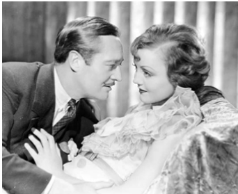
1933 J'AIME CET HOMME (I love that Man) d'Harry Joe Brown avec Edmund Lowe