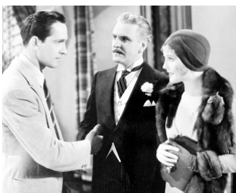
1930 LAUGHTER d'Harry Abbadie d'Arrast avec Fredric March, Frank Morgan