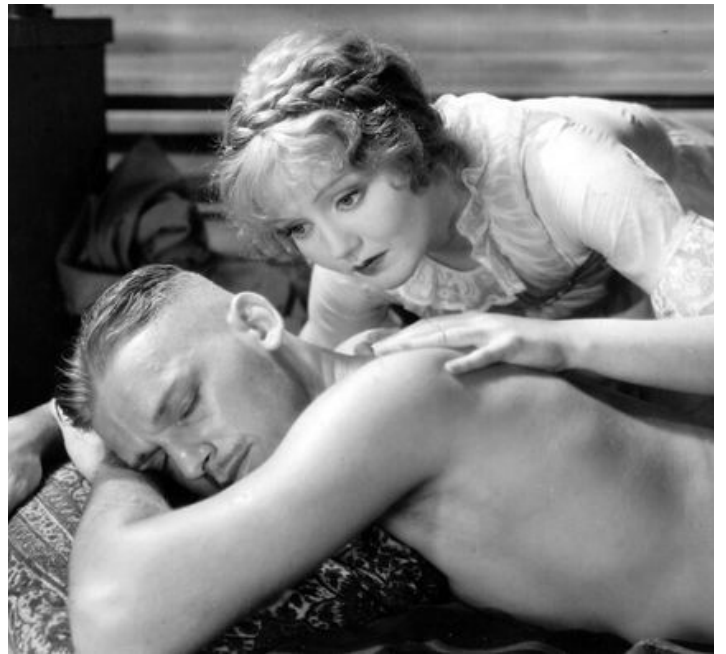
1932 FILS DE RUSSIE (Scarlet Dawn) de William Dieterle avec Douglas Fairbanks Jr