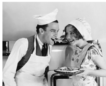
1930 GOÛT DE MIEL (Honey) de Wesley Ruggles avec Stanley Smith