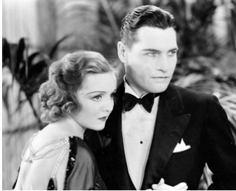
1931 WAYWARD d'Edward Sloman avec Richard Arlen