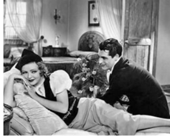
1932 HOT SATURDAY de William A. Seiter avec Cary Grant