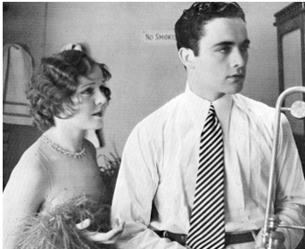
1929 HARMONIE (Close Harmony) d'A. Edward Sutherland avec Charles Buddy Rogers