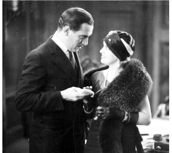
1929 LE LOUP DE WALL STREET (The Wolf of Wall Street) de Rowland V. Lee avec Paul Lukas