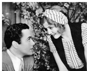
1930 FOLLOW THRU de Lloyd Corrigan & Lawrence Schwab avec Charles Buddy Rogers