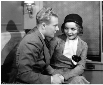
1931 PERSONAL MAID de Monta Bell & Lothar Mendes avec Gene Raymond