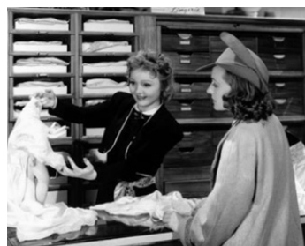
1938 LA PAUVRE MILLIONNAIRE (There goes my Heart) de Norman Z. McLeod avec Virginia Bruce