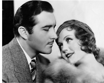
1932 TAXI GIRLS (Child of Manhattan) d'Edward Buzzell avec John Boles