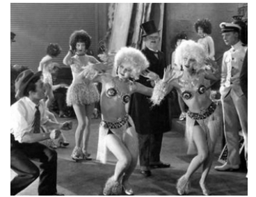
1928 LES FRUITS DÉFENDUS (Chicken a La King) d'Henry Lehrman avec Frances Lee