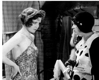
1929 LA DANSE DE LA VIE (The Dance of Life) d'A. Edward Sutherland avec Dorothy Revier