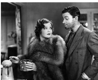
1935 LE DANSEUR MASQUÉ (After the Dance) de Leo Bulgakov avec George Murphy