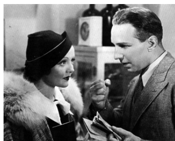
1935 L'AVENTURE TRANSATLANTIQUE (Atlantic Adventure) d'Albert S. Rogell avec Lloyd Nolan