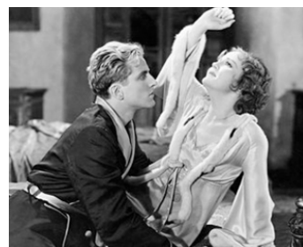
1930 STOLEN HEAVEN de George Abbott avec Phillip Holmes