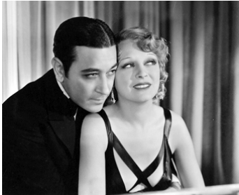
1932 UNDER COVER MAN de James Flood avec George Raft