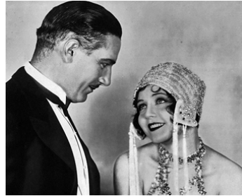
1928 MANHATTAN COCKTAIL de Dorothy Arzner avec Paul Lukas